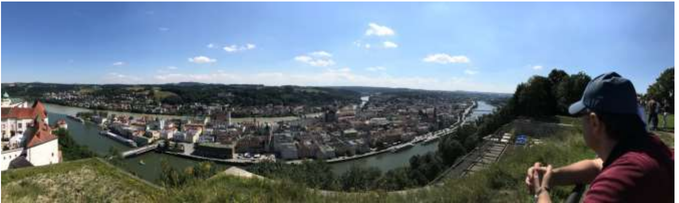
Bernd Stigger genießt die Aussicht auf Passau