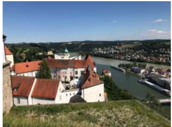
Dann ging es zum Festgelände (Mehrzweckhalle Salzweg unten im Bild) wo wir ein Konzert spielten.