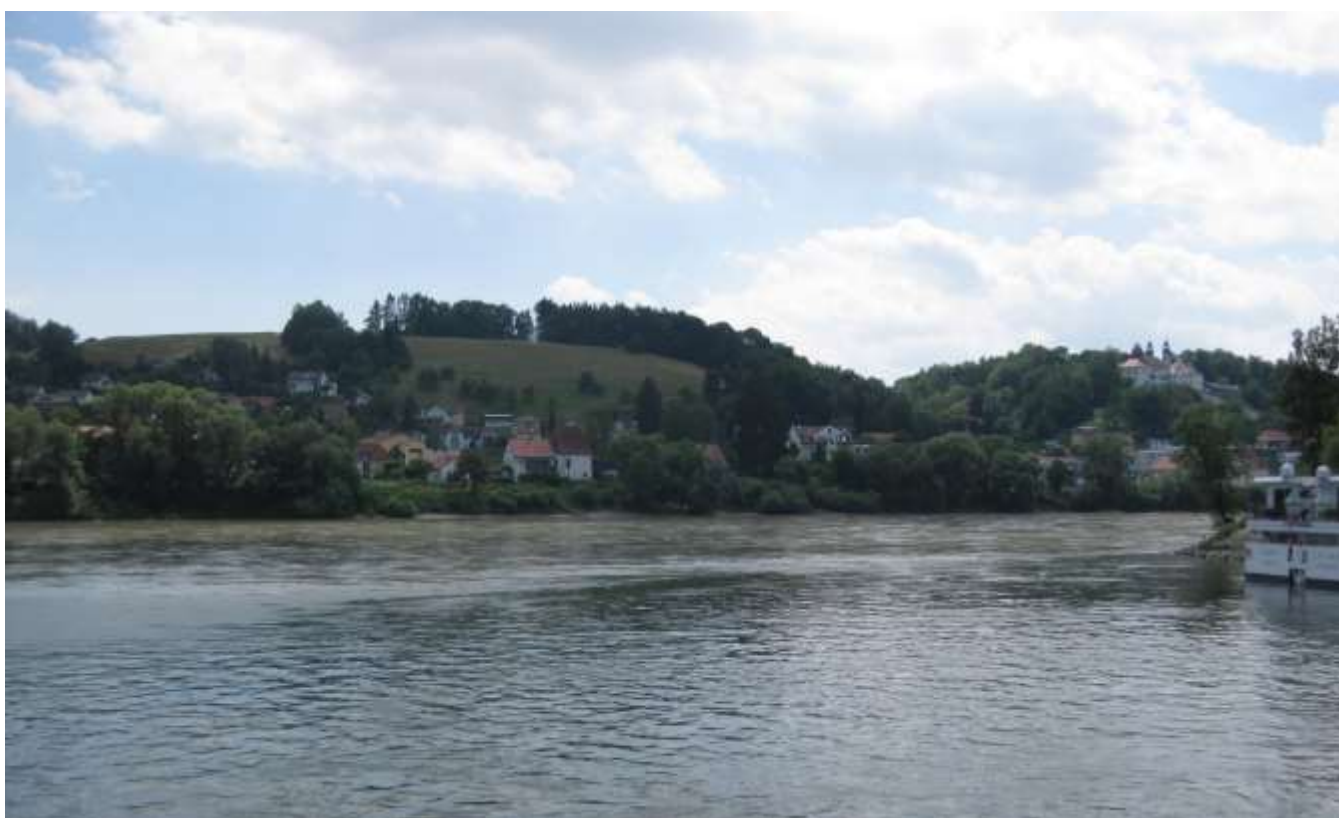
Der Punkt an dem der Inn in die Donau fließt.