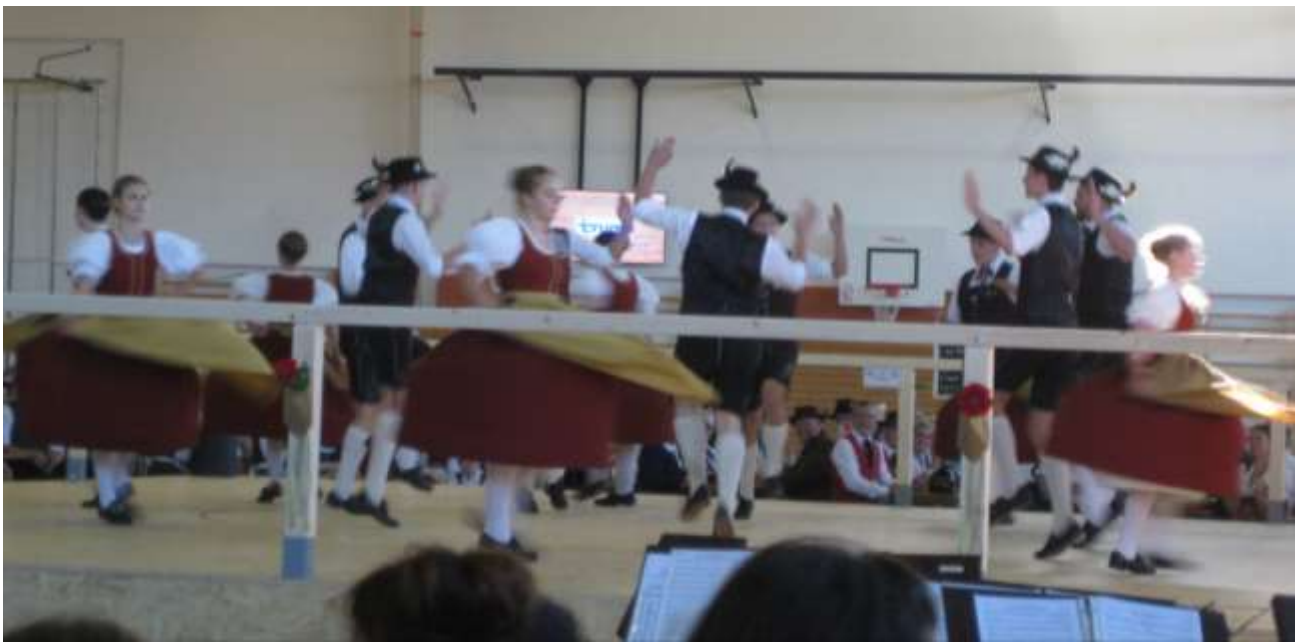
Die Jugendgruppe des Salzweger-Trachtenvereins bei ihrer Darbietung.