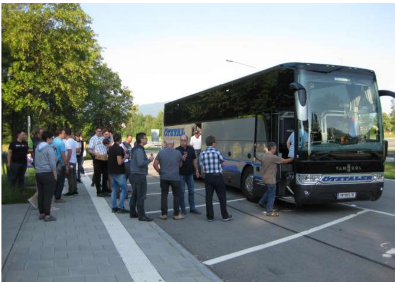
Kurze Snackpause auf einer Autobahnraststätte.